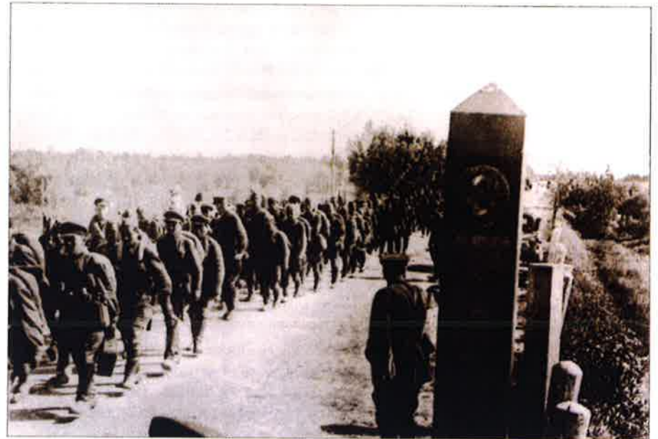
Les soldats de l'Armée rouge traversent la frontière Lituanie-URSS. Le 15 juin 1940