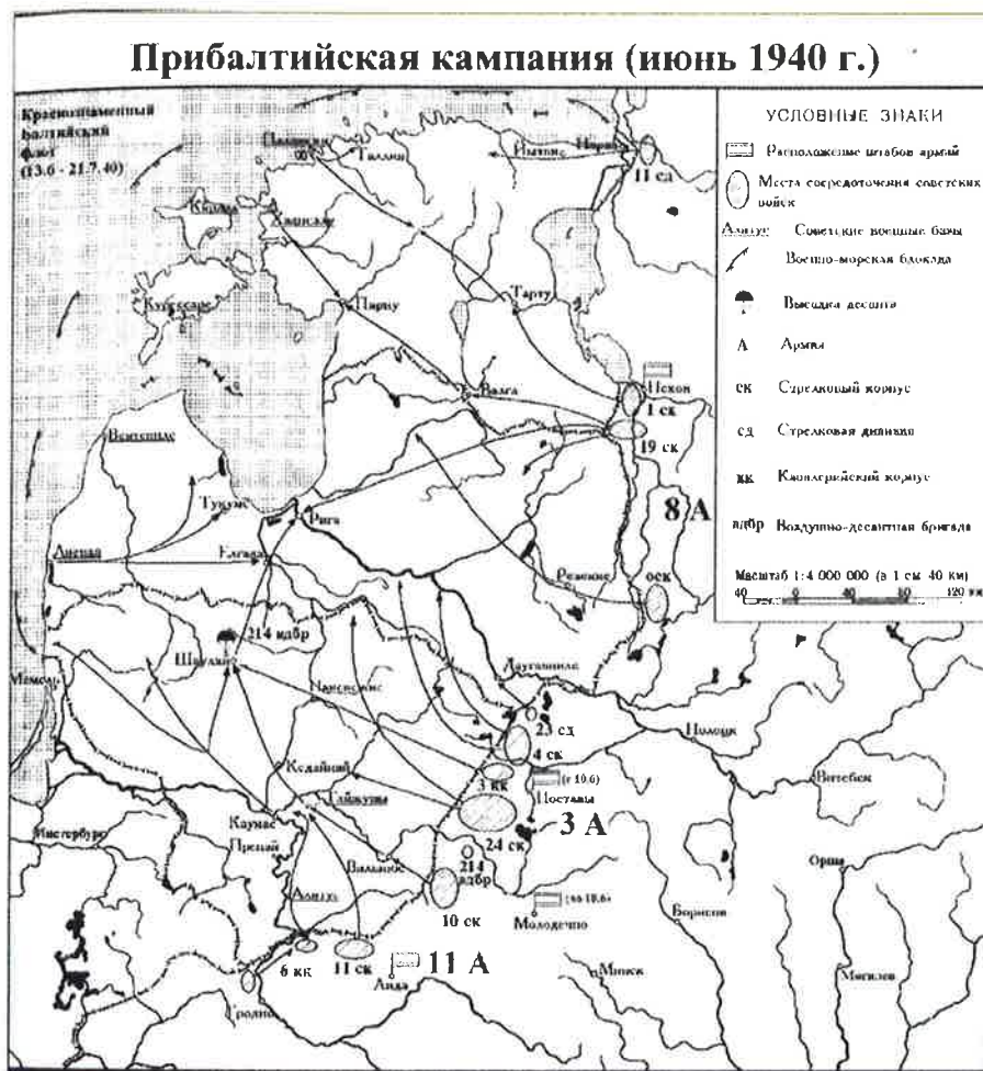
Le plan de l'occupation

déployés près de Gaižiūnai afin de préparer une vaste opération de débarquement. Mais tous les efforts s'avèrent inutiles : la Lituanie est occupée sans combat. Le déploiement des troupes aux frontières du pays et une pression politique, militaire et diplomatique massive y ont également contribué.