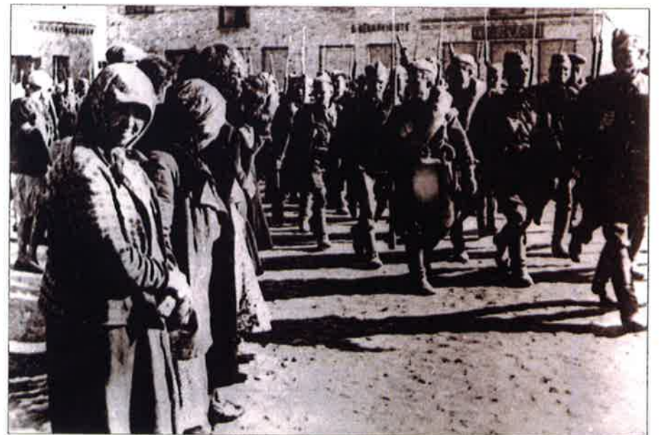
Les troupes de l'Armée rouge traversent la ville Eišiškės, le 15 juin 1940