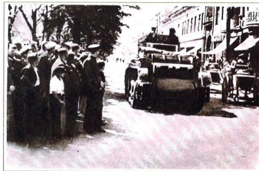
L'armée d'occupation entre à Kaunas, le 15 juin 1940

grave et dangereuse du droit international. En annexant la Crimée et mobilisant son armée aux frontières ukrainiennes, la Russie a porté atteinte non seulement à l'Ukraine mais aussi au système d'accords internationaux. Le Parlement européen a noté que « l'affirmation de la Russie selon laquelle elle a le droit de protéger par tous les moyens les minorités russes établies dans les pays tiers (...) ne se fonde sur aucune disposition du droit international, contrevient aux principes fondamentaux de la conduite des affaires internationales au 21 e siècle et menace l'ordre européen d'après-guerre. » Selon Jeffrey D. Sachs, professeur d'économie à l'Université de Columbia, si la Russie ne change pas le cours de sa politique, on devrait s'attendre à de graves conséquences mondiales, les relations internationales deviendraient plus tendues et marquées par le nationalisme. Une erreur d'une partie ou d'une autre peut conduire à une guerre tragique. Les événements du siècle dernier qui ont eu lieu avant la Première Guerre mondiale, prouvent que la seule façon d'assurer la sécurité dans le monde est le droit international qui est soutenu par les Nations Unies et respecté par tous les pays.