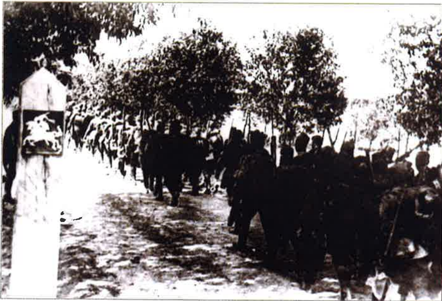
Les soldats de l'Armée rouge traversent la frontière Lituanie-URSS. Le 15 juin 1940

Les orientations de la politique expansionniste du Kremlin sont clairement définies dans la directive N° 5258ss de la Direction politique de l'Armée rouge : « Notre mission est claire. Nous voulons assurer la sécurité de l'URSS, verrouiller tous les accès à la mer près de Leningrad et sécuriser nos frontières Nord-Est. Nous réaliserons nos objectifs historiques malgré l'opposition des chefs des cliques anti-populaires estoniens, lettons et lituaniens, et nous aiderons la classe ouvrière de ces pays à se libérer. (...) La Lituanie, l'Estonie et la Lettonie seront des avant-postes soviétiques sur nos frontières maritimes et terrestres. L'attaque doit se préparer dans le plus grand secret. (...) Nous devons rapidement désintégrer l'armée de l'ennemi, démoraliser ses forces arrière et ainsi aider la direction de l'Armée rouge à remporter la victoire dans les plus brefs délais et avec des pertes minimales. »