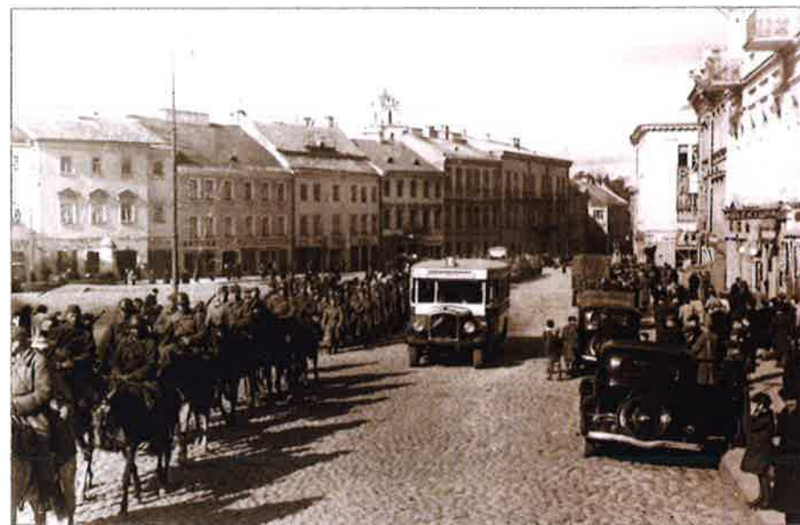
La colonne de soldats de l'Armée rouge à Vilnius. Septembre 1939

Afin d'exercer une pression militaire et politique sur les États baltes neutres, le 13 août 1939, une unité de l'armée de Novgorod est formée dans le district militaire de Leningrad avant d'être réorganisée, le 14 septembre, en 8 e armée, comptant 100 000 soldats et un corps supplémentaire. Au total, 135 000 soldats sont déployés à la frontière avec l'Estonie. La 7 e armée est mobilisée dans le district de Kalinin : elle sera déployée à la frontière lettonne. 169 000 soldats de la 7 e armée sont transférés dans le district militaire de Leningrad. La directive N° 043 du 26 septembre ordonne la mobilisation des troupes à la frontière, avant le 29 septembre. L'armée aura pour tâche d'occuper Tallinn et Tartu. Si la Lettonie fournit une aide militaire à la 7 e armée, les troupes procéderont à une occupation rapide de Riga. La marine militaire devra empêcher le retrait de la marine estonienne en Finlande et en Suède. La 3 e armée avec ses 194 000 soldats et 1078 chars est mobilisée contre la Lituanie. Le 27 septembre, à Moscou, Staline informe Ribbentrop du maintien « temporaire » en Estonie de l'ancien système gouvernemental. Si la Lettonie refuse de signer le Pacte dans les mêmes conditions que l'Estonie, l'armée soviétique « écrasera la Lettonie en peu de temps ». En ce qui concerne les pays baltes, « les derniers seraient apeurés et n'envisageraient aucune attaque », selon Staline. Fin septembre 1939, 437 235 soldats, 3 052 chars et