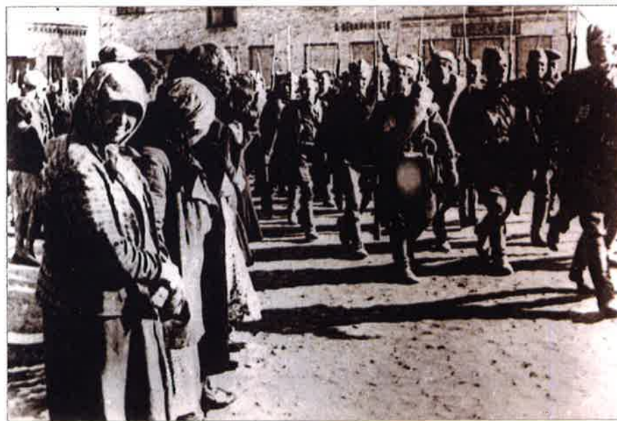
Части Красной армии в Эйшишкес. 15.06.1940 г.