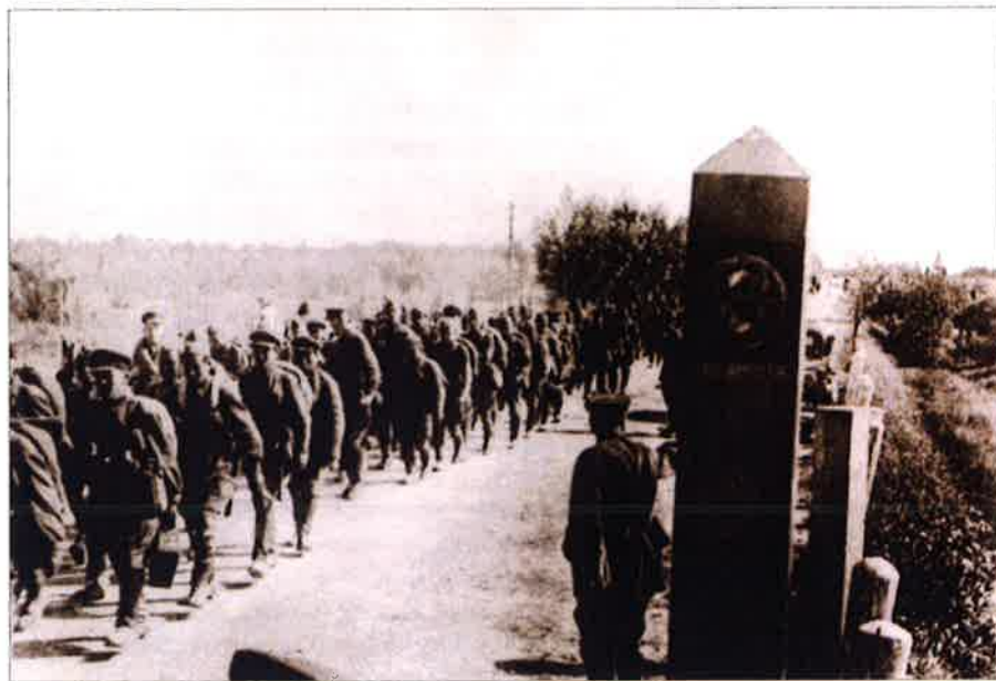
Солдаты Красной армии переходят границу СССР-Литвы. 15.06.1940 г.

должны были «действовать тихо – штыком», за час до начала наступления они получили приказ на несколько часов отложить вторжение. 15 июня в 7 часов утра завершилось заседание правительства Литвы, было принято решение согласиться со всеми требованиями советской власти. Требования ультиматума, которые Советский Союз собирался реализовать «безотлагательно и безусловно», были приняты. Правительство констатировало, что «принимает требования, хотя они противоречат договору от 10 октября» (Договор о взаимопомощи от 10 октября 1939 г.). Таким образом правительство надеялось сохранить независимость Литвы. Но этому свершиться было не суждено. 15 июня в 15 часов солдаты Советского Союза переступили границу Литвы. Около 19 часов танки Красной Армии уже были в Каунасе, окружили Дворец президента, здания правительства, Банка Литвы и другие правительственные учреждения. Советские войска в ходе оккупации Балтийских стран потеряли 58 солдат (15 – самоубийцы, 15 – утонули и 28 – погибли), 158 были ранены, но участвовали в инвазии до конца.