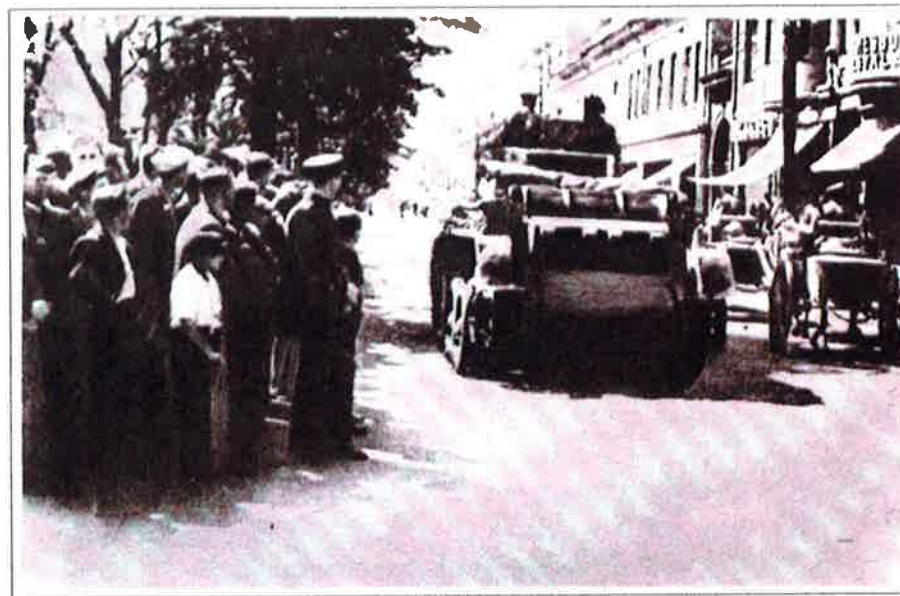
Оккупационная армия вступает в Каунас 15.06.1940 г.

международного права. Россия, захватив Крым, сосредотачивая войска у границы с Украиной, нанесла вред не только Украине, но и системе международных соглашений. Европейский парламент отметил, что «утверждение России о том, что у нее есть право использовать все средства для защиты русскоязычного меньшинства в третьих странах (...) не отвечает положениям международного права и нарушает основополагающие принципы международной жизни в XXI в., а также вызывает опасность порядку послевоенной Европы». По мнению профессора по экономике Колумбийского университета Джеффри Сакс (Jeffrey D. Sachs), если Россия не изменит свою политику, нас ожидают особо серьезные мировые последствия, международные отношения будут еще более напряженными и проникнуты духом национализма. Ошибка с той или другой стороны может привести к трагической войне. В столетней истории до начала Первой мировой войны мы всегда можем найти доказательства того, что единственный способ обеспечения безопасности – международное право, которое поддерживает ООН и уважают все страны.