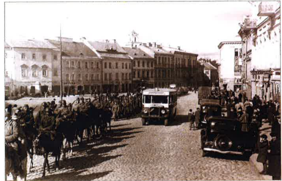
Колонна солдат Красной армии в Вильнюсе. Сентябрь 1939 г.

существующая система власти. Если Латвия откажется от заключения пакта на таких же условиях, как и Эстония, то Советская Армия «в самый краткий срок расправится с Латвией». Оценивая позицию Балтийских стран, Сталин сказал, что «с их стороны в настоящее время не предвидятся никакие эскапады, потому что все они изрядно напуганы». В конце сентября 1939 г. у границ Балтийских стран Советский Союз сосредоточил 437 235 военнослужащих, 3 052 танков и 3 635 артиллерийских орудий.