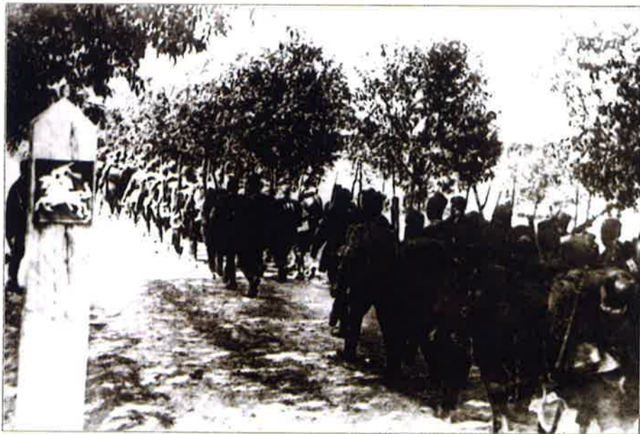
Солдаты Красной армии переходят границу СССР-Литвы. 15 06 1940 г.

Направления тогдашней экспансионистской политики Кремля четко проявляются в директиве Политического управления Красной Армии № 5258сс: «Наша задача ясна. Мы хотим обеспечить безопасность СССР, закрыть с моря на крепкий замок подступы к Ленинграду, нашим северо-западным границам. Через головы правящей в Эстонии, Латвии и Литве антинародной клики мы выполним наши исторические задачи и заодно поможем трудовому народу этих стран освободиться от эксплуататорской шайки капиталистов и помещиков». (...)Литва, Эстония и Латвия станут советским форпостом на наших морских и сухопутных